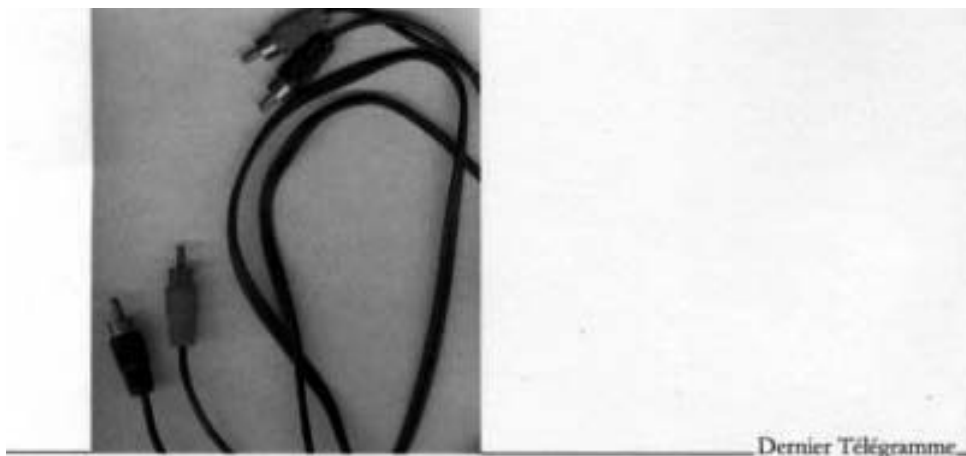
Couverture de Cargo culte , de Emmanuel Rabu